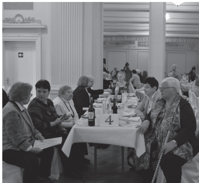
Pesachfirande för seniorerna från Judiska församlingen i Riga är alltid välbesökt.

Bidra till årets pesachpaket! Ett pesachpaket med matze och annat till pesachbordet kostar 240 kr. Tänk på projektet "Bättre livskvalitet för judiska singelföräldrar med barn med särskilda behov i Estland". Stöd PGT 2026, som detta år går av stapeln i Tallinn. Antidemensprojektet i Lettland, "När minnet sviker", är i full gång. Låt fler få möjlighet att ta del av det. Tillsammans hjälps vi åt. Pesach kasher ve sameach!